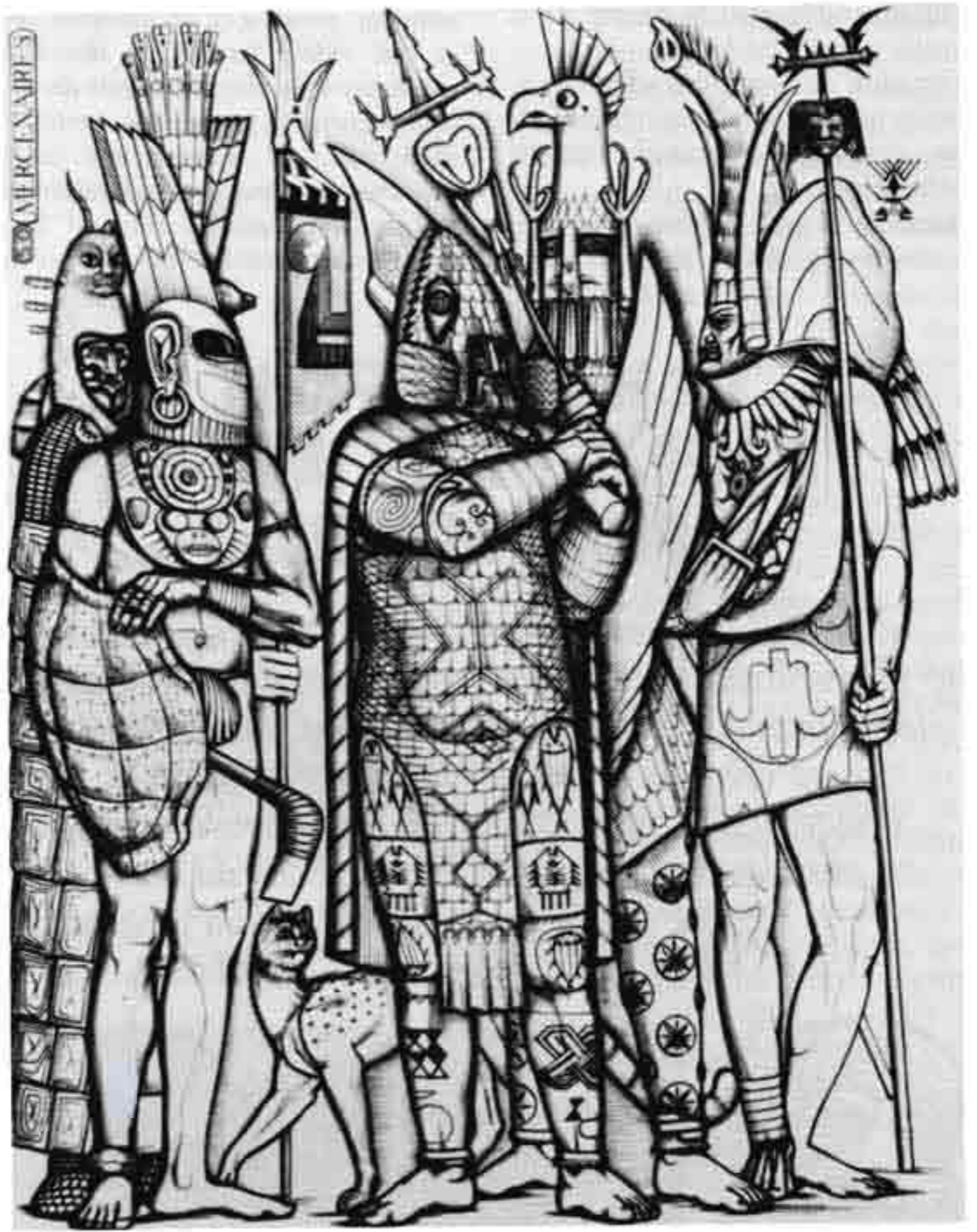
« Salammbô » illustration au burin réalisée pour l'édition, restée à l'état de projet, de cette œuvre de Flaubert (20 × 27 cm).

Pièce qui montre où peut puiser la sensibilité de Jean Delpech.