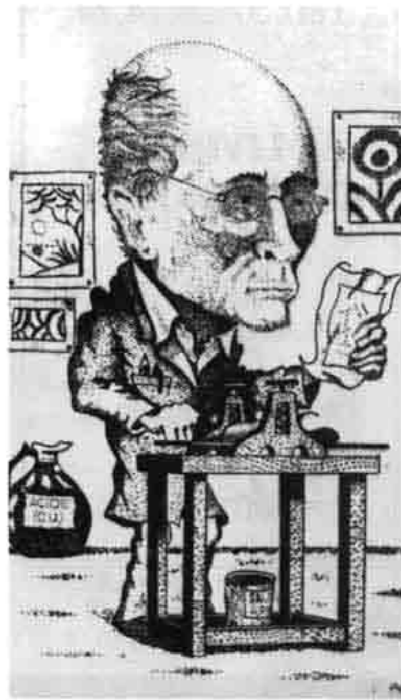
« Caricature » de Jean Delpech (non datée), eau-forte gravée par un de ses élèves (9,9 x 15 cm).

constant sur l'activité artistique qui serait propre à faire vivre un créateur :